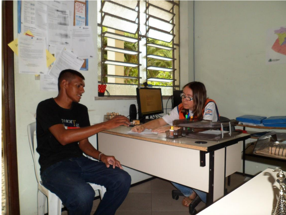
Prestação de conta de usuário do programa de Locação Social