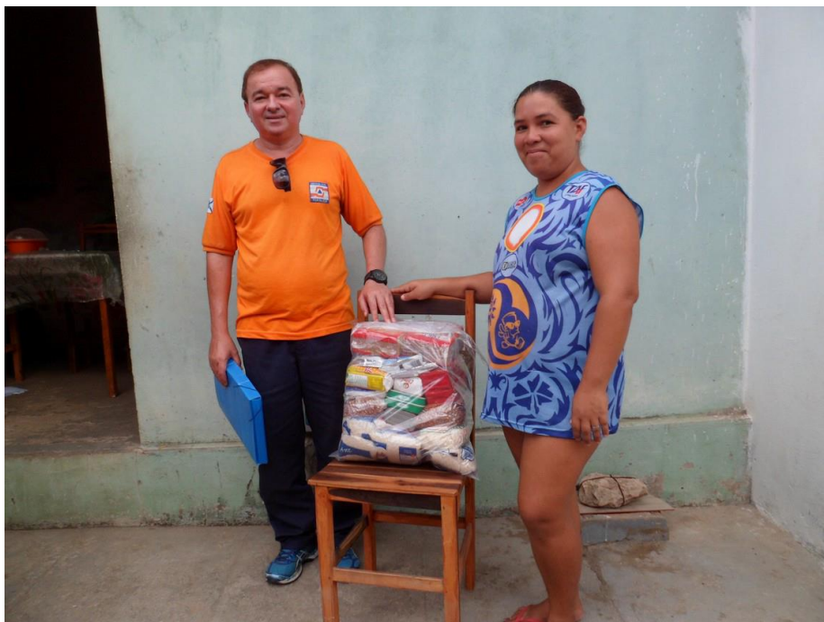
Família em abrigo solidário recebendo assistência